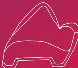
Lateral view – BonSelect TCR